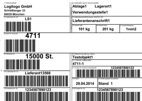
VDA-Etikett für Paletten und Gitterboxen

Stellen Sie Ihre individuelle Angebotsanfrage über die Kontaktseite auf www.vda-etikett.de oder mit den unteren Kontaktdaten.