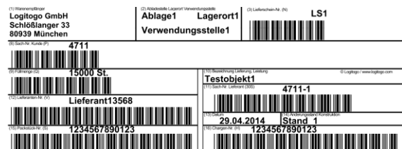
KLT-Etikett für Kleinladungsträger