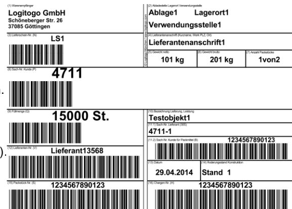
VDA-Etikett für Paletten und Gitterboxen

Stellen Sie Ihre individuelle Angebotsanfrage über die Kontaktseite auf www.vda-etikett.de oder mit den unteren Kontaktdaten.