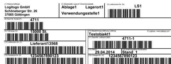
KLT-Etikett für Kleinladungsträger